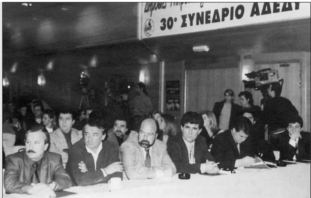
Από την πανηγυρική συνεδρίαση του 30ου συνεδρίου της ΑΔΕΔΥ.

Στο πλαίσιο αυτό συνεχίστηκε η περιοριστική πολιτική στον εισοδηματικό και το δημοσιονομικό τομέα, με το κυρίως βάρος της κυβερνητικής προσπάθειας να πέφτει στη συγκράτηση των δαπανών, τη μείωση του Δ.Τ.Κ., τον περιορισμό των ελλειμμάτων.