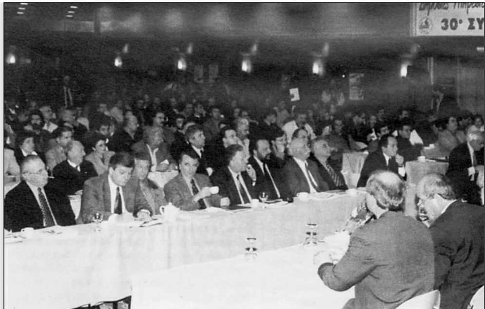
Μια άποψη των επισημών. Δεξιά τα μέλη του προεδρείου του Συνεδρίου.

Ο νέος Δημοσιοϋπαλληλικός Κώδικας, αίτημα του συνδικαλιστικού κινήματος από τη δεκαετία του '80 παρά τα θετικά του χαρακτηριστικά, δεν ανταποκρίνεται στο καθολικό αίτημα των εργαζομένων και της κοινωνίας για αξιοκρατία και αντικειμενικότητα στην εσωτερική λειτουργία της δημόσιας διοίκησης.