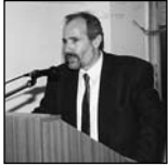
Γιάννης Κουτσούκος πρόεδρος της ΕΕ της ΑΔΕΔΥ

Γεννήθηκε στην Αμαλιάδα το 1953 και σπούδασε στο Οικονομικό Πανεπιστήμιο Αθηνών (ΑΣΟΕΕ).