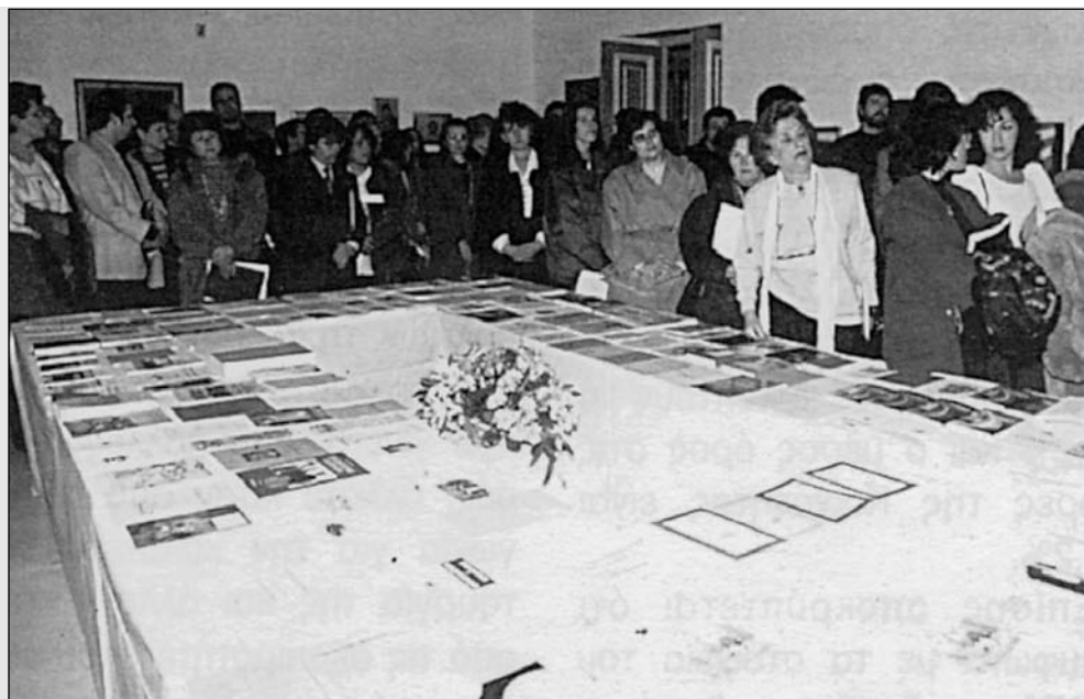
Από την έκθεση ζωγραφικής και λογοτεχνικού βιβλίου που πραγματοποιήθηκε στις 21 Νοεμβρίου 1995 στα πλαίσια του 29ου συνεδρίου της ΑΔΕΔΥ.

Στα εγκαίνια της Έκθεσης που πραγματικά σημείωσε μεγάλη επιτυχία παραβρέθηκαν ο Αναπληρωτής Υπουργός Εσωτερικών κ. Γ. Δασκαλάκης, ο πρόεδρος της ΓΣΕΕ κ. Χρ. Πρωτόπαπας, εκπρόσωποι των κομμάτων και πλήθος δημοσίων υπαλλήλων μεταξύ των οποίων και οι εκθέτες.