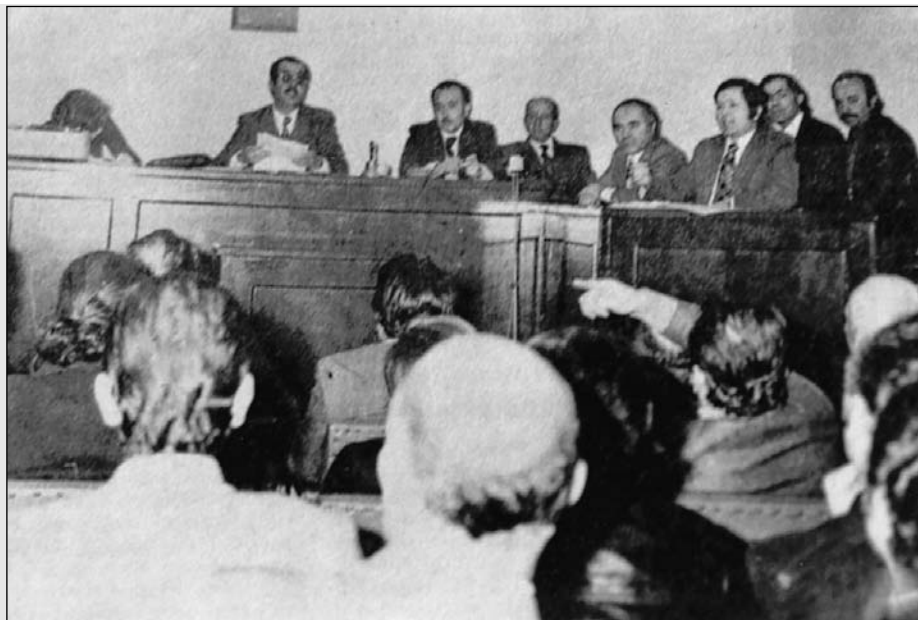
Η Εκτελεστική Επιτροπή, που προέκλυσε από το 23ο συνέδριο της ΑΔΕΔΥ, επί τω έργω.

Διατέλεσε μέλος της Εκτελεστικής Επιτροπής της ΑΔΕΔΥ και στη συνέχεια, όταν συνταξιοδοτήθηκε, μέλος του Γενικού Συμβουλίου της Πανελλήνιας Ομοσπονδίας Πολιτικών Συνταξιούχων. Προέρχονταν από τους υπαλλήλους του Υπουργείου Πολιτισμού και Επιστημών. Απεβίωσε στις 30 Νοεμβρίου 1978.