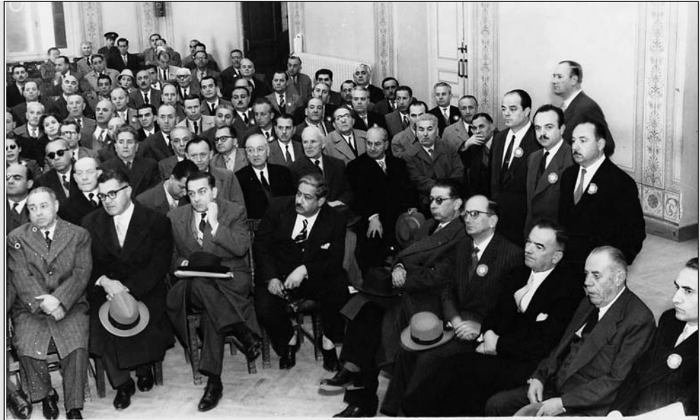
Από εκδήλωση στη διάρκεια του 13ου Συνεδρίου της ΑΔΕΔΥ το Δεκέμβριο του 1956.